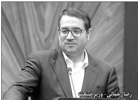
رضا رحمانی - وزیر صنعت