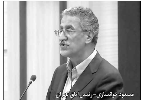
مسعود خوانساری - رئیس اتاق ایران

وی اظهار داشت: به طور طبیعی جامعه‌ای که به نخبگان خود پشت کند یا آنها را نادیده بگیرد محکوم به فروپاشی است و تشکل‌هایی که مجمع نخبگان به حساب می‌آیند زمانی که نظر و دیدگاه آنها به بازی گرفته نمی‌شود دچار یأس شده و اعتماد عمومی آنها خدشه‌دار می‌شود ضمن اینکه بدنه اجتماعی کشور نیز درک می‌کند که نظام اقتصادی و سیاسی مستقل از