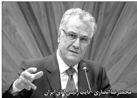
محمد رضا انصاری - نایب رئیس اتاق ایران