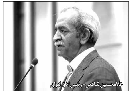
غلامحسین شافعی - رئیس اتاق ایران

مسئولان ناگهان بدون هیچ هماهنگی سیاستی را ابلاغ می‌کنند که سرمایه و پیگیری‌های طولانی‌مدت سرمایه‌گذاران را نقش بر آب می‌کند و متأسفانه در این حوزه هیچ مشورتی از بخش خصوصی و تشکل‌ها صورت نمی‌گیرد.